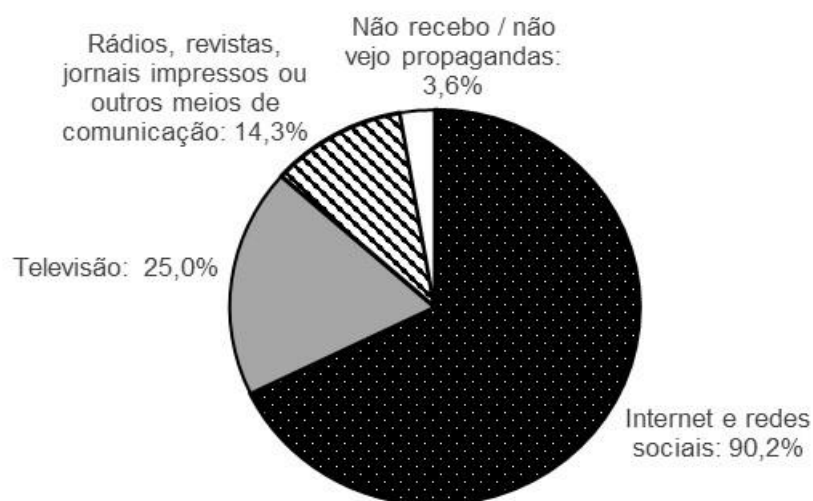
Gráfico 3 – Meios pelos quais costumam receber propagandas.

Quando questionados sobre quais meios costumam receber propagandas, a internet e as redes sociais apresentou grande destaque, com 90,2% das menções. A distribuição das citações é apresentada no gráfico a seguir: